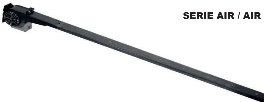
SERIE AIR / AIR SERIES